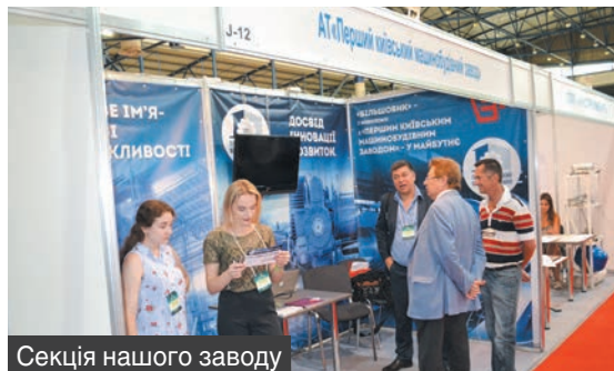
Секція нашого заводу

5 червня в столичному Міжнародному виставковому центрі відбулася щорічна виставка-презентація промислової продукції та науково-технічних досягнень під загальним гаслом «Зроблено в Києві». Головним організатором цього заходу виступила Київська міська державна адміністрація (КМДА). У проведенні виставки взяв участь і «Перший київський машинобудівний завод».