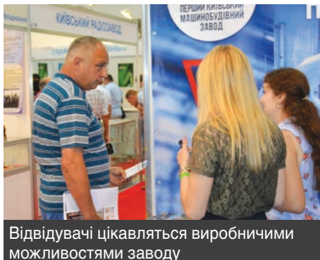
Відвідувачі цікавляться виробничими можливостями заводу

– Вже втретє ми збираємо столичних товаровиробників. Цьогорічний захід «Зроблено в Києві» буде наймасштабніший, експозиційна площа зростає вдвічі. В перший рік при проведенні виставки