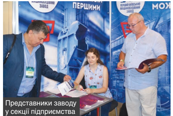
Представники заводу у секції підприємства