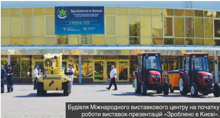
Будівля Міжнародного виставкового центру на початку роботи виставок-презентацій «Зроблено в Києві».