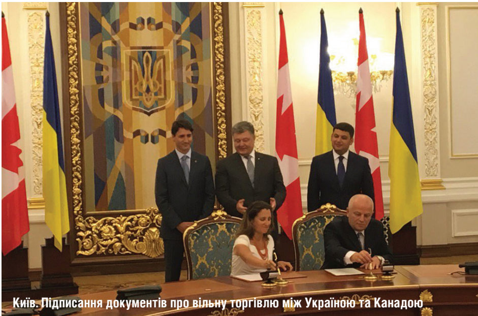
Київ. Підписання документів про вільну торгівлю між Україною та Канадою

Нещодавно в Києві була підписана Угода про вільну торгівлю між Україною та Канадою. Цей документ закладає правові засади режиму вільної торгівлі між нашою країною та однією з найбільших у світі індустріалізованих демократичних держав. Адже Канада входить до складу Великої сімки (G7), Організації економічного співробітництва та розвитку, разом із США та Мексикою, є учасницею Північноамериканської угоди про вільну торгівлю.