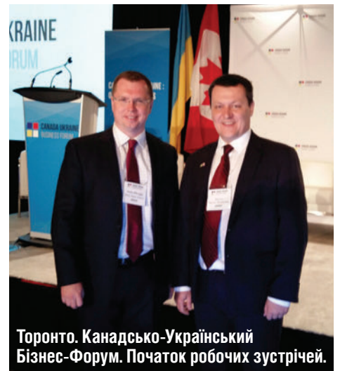
Торонто. Канадсько-Український Бізнес-Форум. Початок робочих зустрічей.

Що ж стосується співпраці з Канадою, то варто привести думку Посла України в Канаді Андрія Шевченка. «У нас є всі підстави розраховувати, що ратифікація Угоди про зону вільної торгівлі буде швидкою. Адже під час візиту Джастіна Трюдо в Україну спікер українського парламенту Андрій Парубій запевнив, що цей документ буде оперативно ратифіковано у Верховній Раді. Ми сподіваємося на таку саму швидкість і з канадського боку», – сказав він. Крім того Посол зазначив, що в цьому питанні має допомогти дуже потужна група дружби Канада-Україна в канадському парламенті яка складає 85 депутатів.